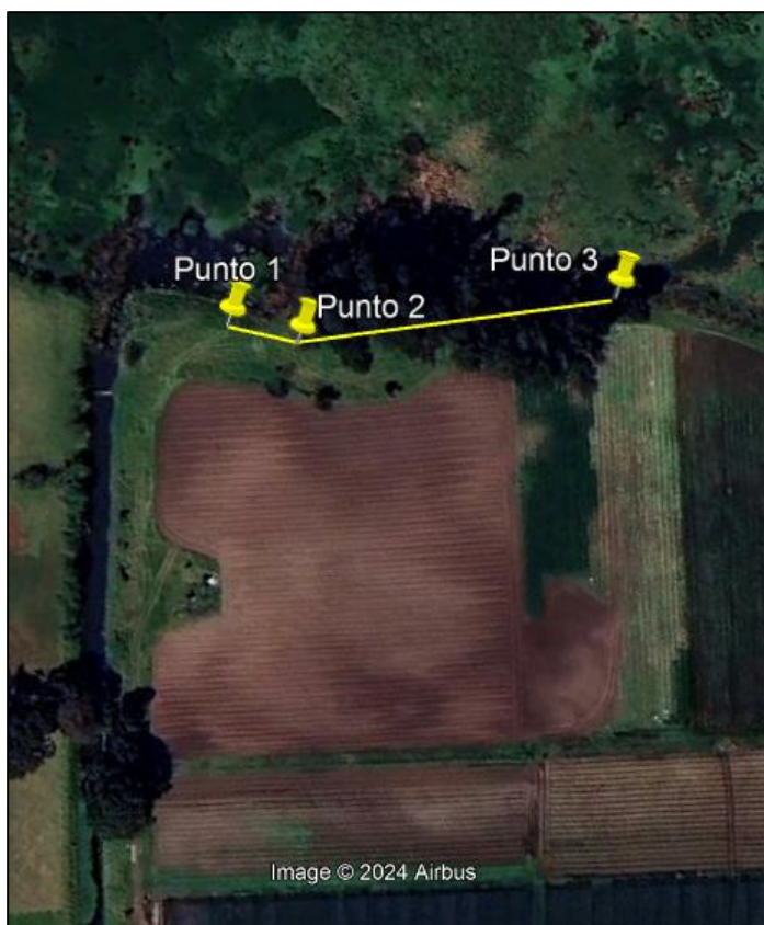
Ilustración 1. Recorrido

Con base en lo anterior, el día 05 de diciembre de 2024 se realizó recorrido de control y vigilancia en el humedal Gualí desde las coordenadas 4°42'53,064" N-74°10'53,466" W hasta las coordenadas 4°42'56,466"N - 74°10'55,698"W (ver ilustración 1. Ruta amarilla) vereda Hato, ecosistema que fue declarado por la Corporación Autónoma Regional de Cundinamarca - CAR como Distrito Regional de Manejo Integrado a través el acuerdo 001 de 2014 "Por medio del cual se declaran como Distrito Regional de Manejo Integrado (DMI), los terrenos comprendidos por los humedales de Gualí, Tres Esquinas y Lagunas de Funzhé, y su área de influencia directa ubicada en los municipios de Funza, Mosquera y Tenjo, Cundinamarca", y estableció tres zonas: 1. Preservación (espejo de agua), 2. Recuperación (50 metros) y 3. Uso sostenible (100 metros).